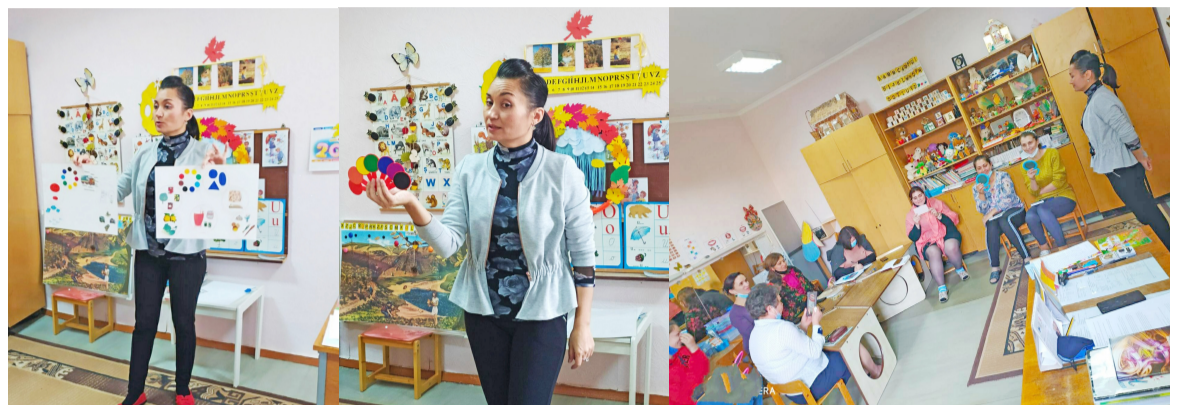
Secvențe din cadrul Atelierului logopedic pentru educatori